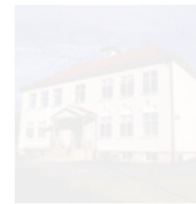
BEVARINGSDIPLOM: Røkeberg skole i Vestfossen.