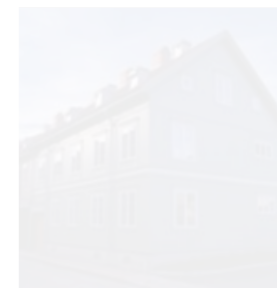
BEVARINGSPRIS: Øvre Storgate 46 og 48.

ble bygd i 1921 som folkeskole. Det er en toetasjes bygning med valmtak, bygd i nyklassisistisk stil med en symmetrisk bygningskropp. Skolen ble nedlagt i 1972. Nå huser bygningen rundt 60 barn i barnehagen, som har fokus på natur og kultur. Istandsettingen har tatt hensyn til bygningens stilpreg og egenart, heter det fra Fortidsminneforeningen.