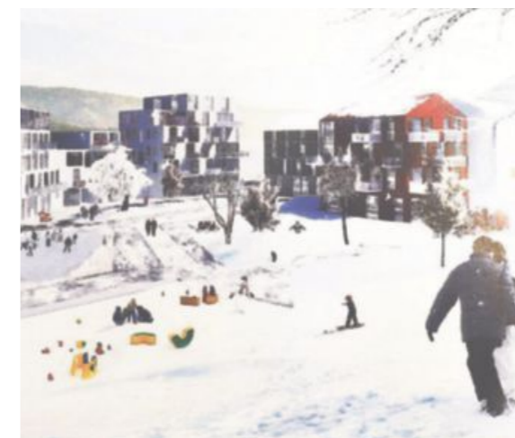
VINTER PÅ GLASSVERKET: Akebakker og vinteraktiviteter bak den nye fjordbyen som vil se dagens lys om få år.