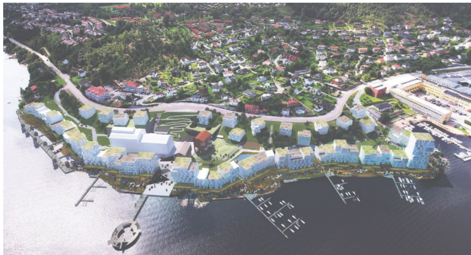
SLIK KAN DET BLI: Glassverket slik det kan bli om få år. Vi ser Svelvik veien snor seg bak, Nøste-området til høyre. De nye boligene etter hverandre helt ut mot fjorden med brygger og strandpromenade. Bak bygningene blir det grøntområde.

TEGNING/GRAFIKK: UNION EIENDOMSUTVIKLING/A-LAB-ARKITEKTER